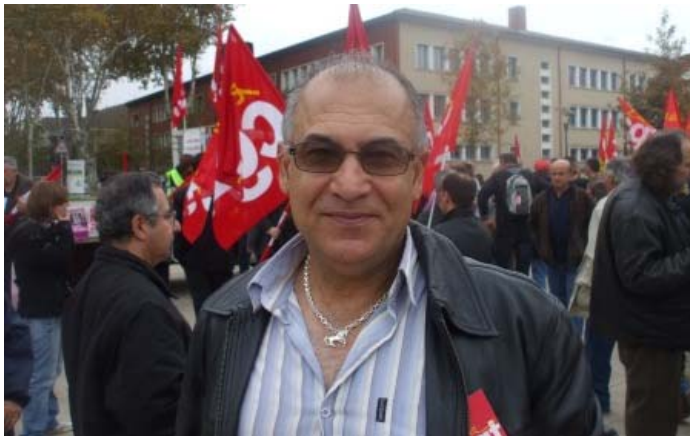
پروفايل: سالی 1957 له شاری کهرکوک له دایک بووه . له سالی 1988 له فهرنسا ده‌ژي له سالی 1996 بووه ته نندامی ( C.G.T. ) و له کونگره‌کانی 21، 22 و 23 ی ناوچه‌ی 82 به نندامی مه‌کتبی ته‌نفیزی هه‌لنگريکاري . سهره‌پای کارکردن له زانکوی تولوس خهریکی خویندنه له به‌شی دهرورنناسی

یونان که بؤ پشټیوانی له کرځيکارانې فهرنسا مانگرترنو خوېشانندانیان کرد، یاخود له روسیا که پځکراوه کرځيکاريه‌کان چوونه به‌ردم سه‌فاره‌تی فهرنسی له مؤسکر، پشټگيریان کردو ناپه‌زایه‌تیاں به‌رانبر سه‌فاره‌ت دهربرې و نه‌و جوړه شتانه . به‌لی بیگومان نیمه‌چاوه‌پوانی نه‌وه‌ین چونکه مه‌سه‌له‌ی کرځيکارانې فهرنسا له مه‌سه‌له‌ی کرځيکارانې ولاتانی تر به‌در نیبه . کرځيکاران هه‌موویان یک نامانجیان هه‌یه جا هر کویبه‌ک بیت زه‌مینیان و هر چیه‌ک بیت په‌گه‌زیان، هه‌موویان یک نامانچ مه‌به‌ست کویان ده‌کاته‌وه، که سهرفرانکردنی چینی کرځيکاره . هر بویه نیمه‌چاوه‌پوانی نه‌وه‌ین که کرځيکاران نه‌گه‌ر به‌په‌مزیش بیت پشټیوانی خوین له نیمه‌نیشان بدن و من نه‌وه به‌دوریش نازانم، چونکه له مانگی 12 دا خوېشانندانکی کرځيکاري نه‌وروی ده‌کریت که هه‌موو سه‌ندیکا نه‌ورویبه‌کان به‌شدری ده‌کن، هیشتا دباری نه‌کراوه له کوڅ ده‌بیت، دباره له خوېشانندانه مه‌سه‌له‌ی کرځيکارانې فهرنسا مه‌سه‌له‌یکې به‌رچاوه‌دبیت .