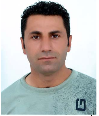
پ/نۆکتۆبەر: په‌یامت چی‌یه‌ له ۱/۶ پوژی جیهانی منالان؟

کامهران له‌تئیف پیشه‌کی به‌ناوی خۆم و ستافی سه‌ننه‌ری به‌رگری له‌مافه‌کانی منالانی کوردستان ئۆفیس‌ی سلیمانی گهرمترین و جیوانترین پیروزی‌ییایی ۱/۶ پوژی جیهانی منالان له‌سه‌رتاسه‌ری جیهان و عیبرق ده‌که‌م به‌تایبه‌تی منالانی کوردستان، که‌به‌داخه‌وه منالانی کوردستان زۆریکیان بی ناگان له‌م پوژی خویان که‌پویتیست بووگه‌وره‌ترین و جیوانترین ناهه‌نگ و خوشیان بو به‌ریک بخرایه‌ ئه‌گهر به‌شیوه‌یه‌کی گشتی سه‌رنج بده‌ینه‌سه‌رژانی منالان به‌هوی ئه‌م دنیا‌ی سه‌ره‌مایه‌داری نابهرابه‌ریه‌وه ده‌بینین وه‌زعیه‌تیکی که‌منالانی تیدا‌یه له‌زۆریک وولاتان ئیجگارمه‌ترسیداره به‌تایبه‌تی ئه‌و وولاتانی که‌تایستا به‌ده‌ست