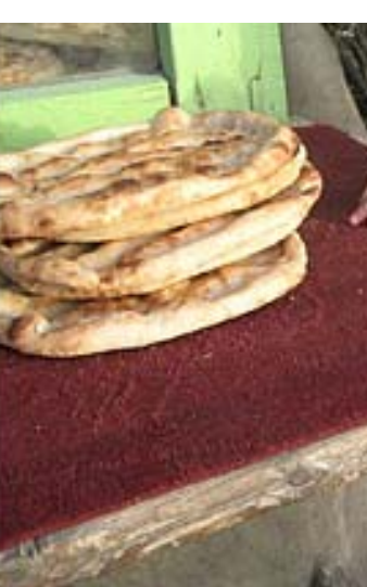
منالیک له‌سه‌ره‌ی ناندا (له‌نازاک به‌که‌روه)

نۆکتۆبەر: له‌م روژانه‌دا بکۆزی "له‌ری مه‌ریوان" بریاری له‌ سیداره‌دانی بۆ ده‌رچوه، تۆ پی‌ت وایه له‌ سیداره‌دانی تاوانباران ریکه‌چاره‌یه بۆ به‌رگرتن به توندوتیژی به‌رامبه‌ر به‌ منالان؟ یان ده‌بی بکریته؟ ئه‌مه‌ل جه‌لال: سه‌ره‌تا له‌ یادی وژی جیهانی منالاندا پیروزیایی ناراسته‌ی سه‌ره‌جم منالان ته‌که‌م له‌هه‌رکۆیه‌ک بن، ئومید ته‌که‌م ته‌م یاده‌ بیته‌ یادیک که‌ ده‌سه‌لاتدارانی سیاسی له‌ وولاتدا سیاست و به‌رنامه‌و ستراتیجی خویان سه‌رله‌نوێ له‌ به‌رزوه‌ندی منالان و ژنان و گه‌نجان به‌تایبه‌تی و ته‌واوی تاکه‌کانی ته‌م وولاته‌ داپه‌ریته‌وه، چیت "له‌ری" و هاوریکانی به‌م شیوه‌ درنده‌یه کۆتایی به‌ژیا‌نیان نه‌یت. سه‌بارت به‌ پرسیاره‌که‌تان له‌ بریاری له‌ سیداره‌دانی بکۆزی "له‌ری" مه‌ریوان" له‌گه‌ل ته‌وه‌ی که‌من بۆخۆم باوه‌رم به" له‌ سیداره‌دان" نیسه، چونکه ته‌مه‌ش کاریکی تره له‌به‌ره‌وام بوونی پرۆسه‌ی توندوتیژی و به‌هه‌مان شیوه‌ ته‌بیته‌وه هۆی به‌ره‌مه‌نیانه‌وه‌ی توندوتیژی. ته‌بیته‌ مرف هه‌میشه له‌پرۆسه‌ی راهینانه‌وه‌ چاککردنی کاربکات. نه‌ک کوشتن به‌کوشتن چاره‌سه‌ر بکریته‌لای هه‌ندیک که‌س مه‌سه‌له‌ی له‌ سیداره‌دان یه‌کیکه‌ له‌ میکانیزمه‌کانی به‌رگرتن له‌ توندوتیژی و بییان وایه که‌به‌م میکانیزمه ده‌توانن ری له‌توندوتیژی بگرن، به‌لام به‌په‌چه‌وانه‌وه. ته‌وه‌تا ده‌بینین روژانه چه‌ندین مرف خۆی ته‌ته‌قیته‌وه‌وه مرفی تریش به‌دوا‌ییدا دوا‌یاری