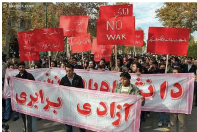
دیمه‌ئیک له‌ جولاوه‌ی 16 ی ئازماری سالی پار له‌ زانکۆی تاران

به‌ رۆژی جهموری ئیسلامی ئێران ده‌ربرێ و داواو خواسته‌ چه‌پ و رادیکال و ئیسلامیه‌کانی خۆیان خه‌ستوو. ئهم جولاوه‌ ئازادپه‌نجاوو چه‌په‌ که