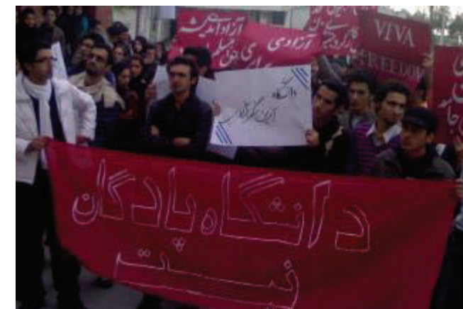
دیمه‌ئیک له‌ جولاوه‌ی 16 ی ئازماری ئه‌مسال له‌ زانکۆی مازنده‌ران

لێدژی حکومه‌ت و نه‌جهدی نه‌ژادی سه‌رۆکی ئێران، یادی رۆژی خۆپه‌نجواری ئێران کردوه‌. وه‌ له‌ چه‌ندین زانکۆ هه‌لپه‌ژان و رووبه‌روو بونه‌وه‌ له‌گه‌ڵ هێزه‌ ئه‌منیه‌کانی حکومه‌تدا